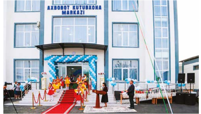
Бағдод туманидаги ахборот-кутубхона марказининг эски ва янги биноси

деган ҳикматли сўзи ўз тасдиғини топмоқда. Фуқаролар механизм ва натижалар ҳақида кўпроқ маълумотга эга бўлгач, уларнинг бу лойиҳага қизиқиши, ишончи ва фаоллиги мос равишда ортиб бормоқда. Ўз соҳасини ривожлантирмоқчи бўлган, давлат бюджетини тўғри ва унумли сарфланишига, ечилмаётган муаммоларни ҳал қилинишига бефарқ бўлмаган фуқароларимиз ўз ташаббуслари билан ижобий натижаларга эришишмоқда.