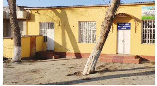
Бешариқ туманидаги ахборот-кутубхона марказининг эски ва янги биноси

бусли лойиҳаларга асосан йўналтириш механизми жорий этилди, бюджет маблағларини тасарруф этувчилар ҳамда маҳаллий давлат ҳокимияти органлари томонидан бюджет маблағларидан фойдаланиш жараёнини тўлиқ ўз расмий сайтларида эълон қилиб боришларини тартибга солувчи қонун ва қонуности ҳужжатларига тегишли нормалар киритилди. Шунингдек, Ўзбекистон Республикаси республика бюджети харажатлари Ўзбекистон Республикаси Олий Мажлис палаталари томонидан, маҳаллий бюджетлар эса тегишли халқ депутатлари кенгашлари томонидан тасдиқлаш амалиёти жорий этилди.