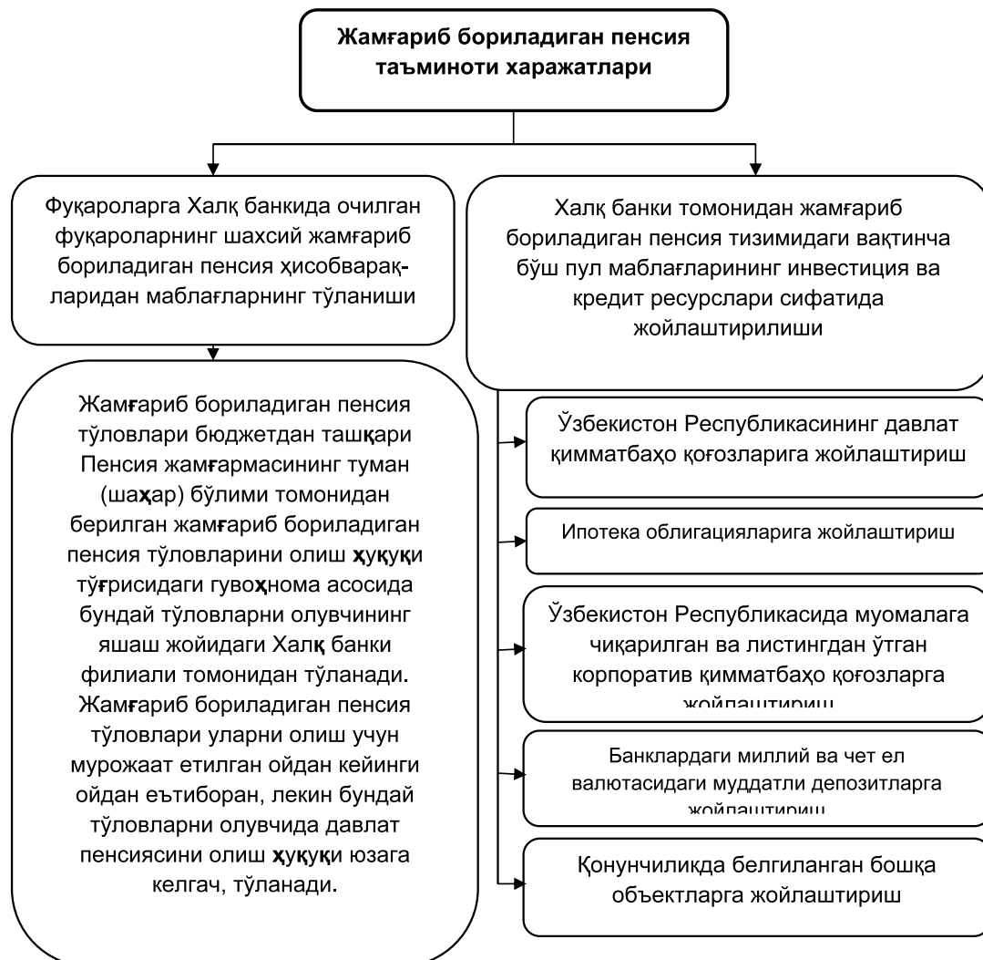
3-расм. Жамғариб бориладиган пенсия таъминоти харажатларининг таркиби ва тузилиши.

фуқаролар юқори пенсия олиш имкониятига эга бўладилар; жамғариб бориладиган пенсия таъминоти қонунчилигига биноан, тизимга жисмоний шахсларнинг иш ҳақидан ихтиёрий ўтказиладиган даромадлар даромад солиғига тортилмайди ва юқори фоизли даромадлилик асосида капитализация қилинади. Ишловчи фуқаролар мана шу омиллар ҳисобига пенсия даврида ўзларининг ижтимоий таъминотлари учун катта миқдорда даромад жамғариш имконига эга бўладилар; белгиланган ставкалардан келиб чиқиб ҳисобланган, бюджетга тўланадиган жисмоний шахслардан олинадиган даромад солиғи суммаси фуқароларнинг шахсий жамғариб бориладиган пенсия ҳисобварақларига ўтказиладиган, жисмоний шахслардан олинадиган даромад солиғи солинадиган даромадларидан «0» ставка бўйича солиқ солинадиган даромад (энг кам иш ҳақининг бир бара-