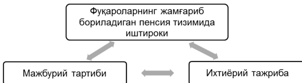
1-расм. Фуқароларнинг жамғариб бориладиган пенсия тизимидаги иштироки 1 .

лар ва инвестициялар rischi, мукофотлар ва пенсия режаси харажатларини қўшган ҳолдаги харажатлар умумий ҳисобланиб, индивидуал тартибда иш берувчиларга қайд этилади. Агент режасида ҳисобларнинг тақсимланиши туфайли ҳар бир иш берувчи ўз ходимларига турли пенсия тўловларини таклиф этиши мумкин. Харажатларни биргаликда амалга ошириш маъносида иш берувчиларнинг ҳар бирининг алоҳида ҳисоблари мавжуд эмас. Барча иш берувчилар ўз ходимларига ўша пенсия тўловларини таклиф этишлари лозим. Биргаликда харажатларни амалга ошириш режасига қўшилишда, иш берувчи пенсия тўловларини ишлаб чиқишда мустақилликни йўқотади. Давлат тармоғида агентлар режаси кам учрайди ва харажатларни тақсимлашга асосланган режалари кўп тарқалган. Штатлар даражасидаги кўпгина пенсия режалари харажатларни тақсимлашга асосланган режаси ҳисобланади ва маҳаллий даражада ва штат ҳукумати иш берувчилари қўшимча равишда кўплаб иш берувчиларни таркибига олиши мумкин.