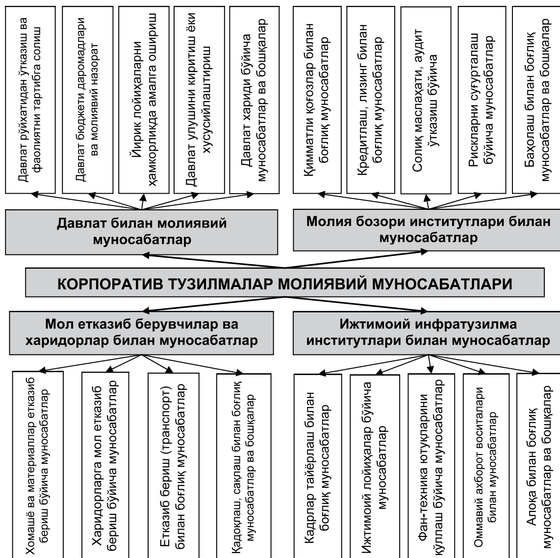
1-расм. Корпоратив тузилмалар молиявий муносабатлари таснифи 1 .

ошириш ҳамда давлат қимматли қоғозларини корпоратив тузилмалар ўртасида жойлаштириш каби ҳолатларгача намоён бўлишини кўрамиз.