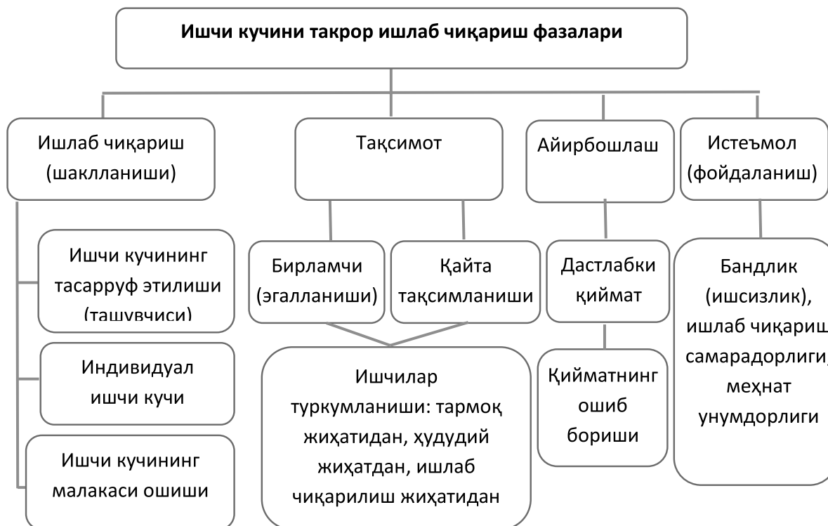
2-расм. Ишчи кучини такрор ишлаб чиқариш кўриниши 1 .

тўғри тадбиркорлик объектида (ишга ёллаш, бошқа ишга ўтказиш, ишдан бўшатиш, ишчи кучини алмашиш қиймати ва ҳоказо) келишиб олинади.