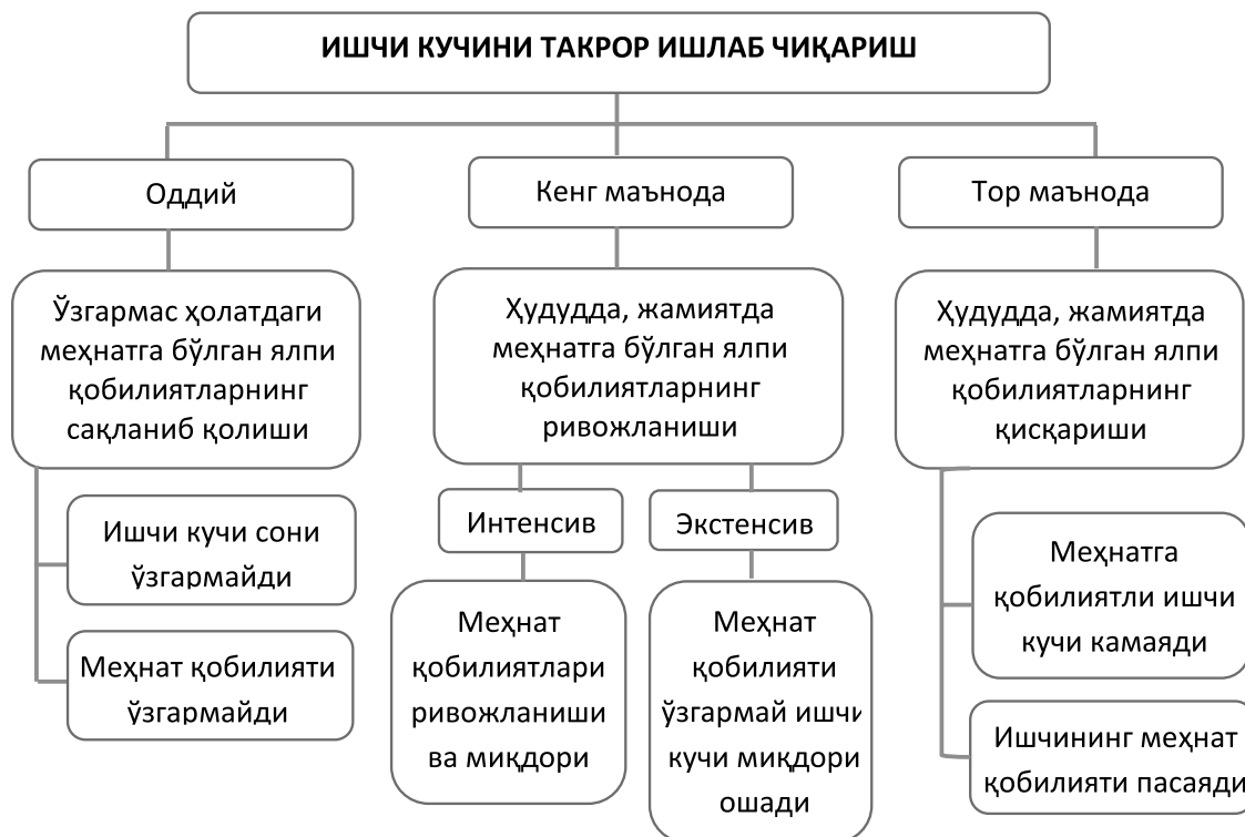
3-расм. Ишчи кучини такрор ишлаб чиқариш турлари 1 .

малакага эга бўлмаганлиги сабабли бошқа касб учун тайёрлов ёки қайта тайёрловдан ўтишга мажбур бўлади.