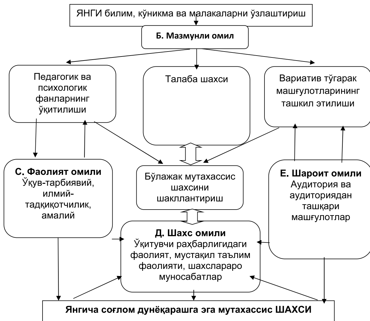
2-расм. Бўлажак ўқитувчиларда саноген тафаккурни ривожлантиришнинг интегратив-таркибий тузилмаси 1

вариатив тўғарак машғулотларининг ташкил этилишига қўйиладиган талаб ва қоидаларни белгилайди. Яъни, талаба таҳсил олиш давомида педагогик-психологик билимларга эга бўлиш билан биргаликда "Саноген фикрлашни ўрганамиз" номли тўғарак машғулотларида иштирок этиш орқали соғлом фикрлаш билан боғлиқ саноген хулқ-атвор кўникмаларини ўзлаштиради.