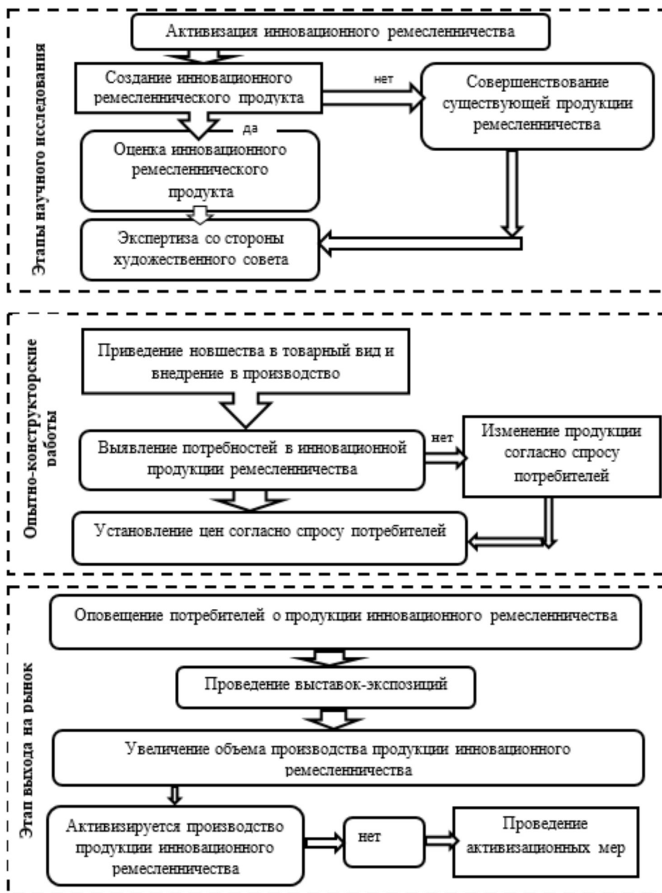
Рис.3. Механизм активизации применения инноваций в ремесленничестве 1 .

Известно, что инновационный цикл включает в себя три этапа – научные исследования (создание инноваций), опытно-конструкторские работы (приведение наработок в товарный вид и внедрение в производство), а также выпуск на рынок продукции. На ремесленном предприятии – мастерской эти этапы осуществляются в целом, без крупных финансовых средств. Успех во многом связан с активизацией создания и применения новаций и их коммерциализацией (рис. 3).