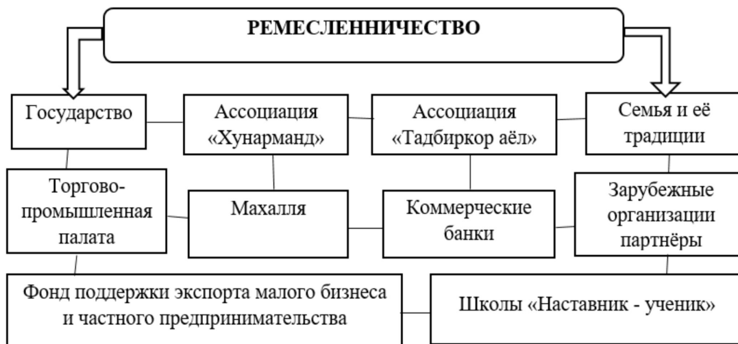
Рис.1. Институциональная основа поддержки ремесленничества 1 .

переросли в пищевую промышленность, сапожное ремесло – в обувную промышленность, портновское ремесло – в швейную промышленность, кузнечное ремесло – в металло-обрабатываемую промышленность.