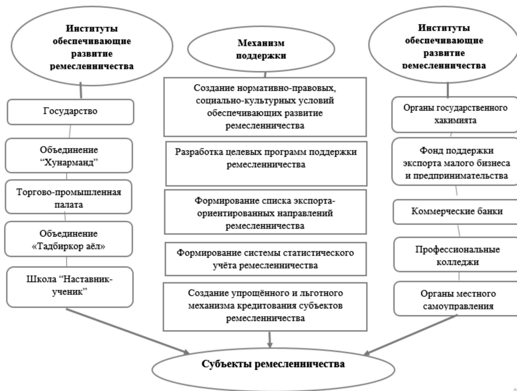
Рис.2. Организационно-институциональная модель механизма развития предпринимательства в ремесленной деятельности 1 .

вноса во внебюджетный Пенсионный фонд. Ремесленникам предоставляется кредит сроком на 2 года, в размере 300 минимальных зарплат, с шестимесячным льготным периодом по выплате основной суммы кредита. Не все ремесленники-предприниматели состоят в членстве Ассоциации «Хунарманд». Многие из них осуществляют свою деятельность неофициально в качестве индивидуального предпринимателя. В дальнейшем целесообразно разработать и совершенствовать механизм их привлечения к ремесленной деятельности. Организационно-институциональная модель развития ремесленничества представлена на рисунке 2.