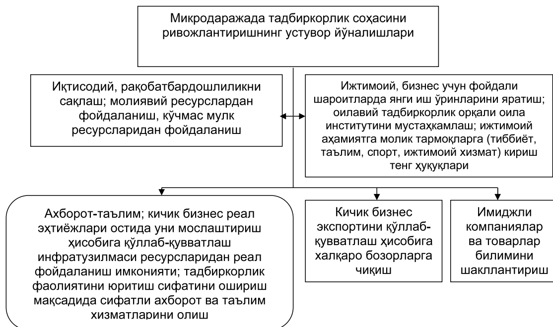
1-расм. Аниқ тадбиркорлик тузилмалари даражасида кичик бизнес ва хусусий тадбиркорликни ривожлантиришнинг устувор йўналишлари.

Бунинг учун республика ҳудудлари даража-сида устувор комплекс чоралар алоҳидалашмаган таркибий бўлимлар томонидан амалга оширилмади, балки кичик бизнес устувор йўналишларига мувофиқ, ижтимоий-иқтисодий ривожланиш стратегияси доирасида бирлаштирилган (1-расм). Барча дастурлар кичик бизнес субъектларининг барча қўллаб-қувватлаш воситаларидан тенг фойдаланиш тамойилига асосланган. Бу эса рақобатлантиришлар ривожланиши шароитида долзарб бўлиб қолади.