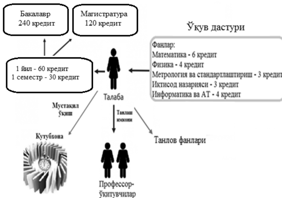
2-расм. Кредит-модуль тизимида талаба фаолияти 1 .

– таълим оловчиларга ишчи ўқув режага киритилган танлов фанларини танлаш, бу орқали индивидуал ўқув режасини шакллантиришда бевосита иштирок этиш ҳуқуқини, шунингдек ўқитувчини танлаш имкониятини беради;