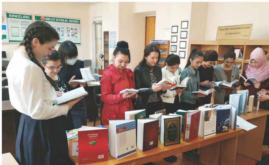
Список использованной литературы:

Создание традиционных и электронных библиографических пособий является перспективным направлением раскрытия информационно-библиотечных ресурсов научного и образовательного характера и представления более широкого доступа к ним пользователей.