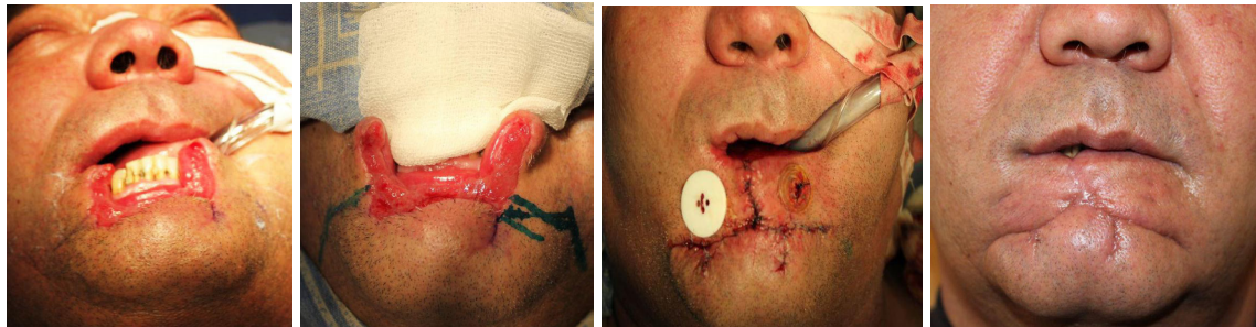
Рис. 1. Этапы операции закрытия дефекта нижней губы билатеральным перемещенным лоскутом.

Применяемые сегодня методы устранения дефектов мягких тканей лица имеют определенные недостатки. Микрохирургическая аутотрансплантация тканей травматична для донорской области и является технически сложным методом. Травматична и многоэтапна пластика с использованием кожно-фасциальных и кожно-мышечных лоскутов с осевым типом кровообращения, выкроенных в области шеи и грудной клетки [3]. Местная пластика с использованием баллонной дерматензии также занимает продолжительное время.