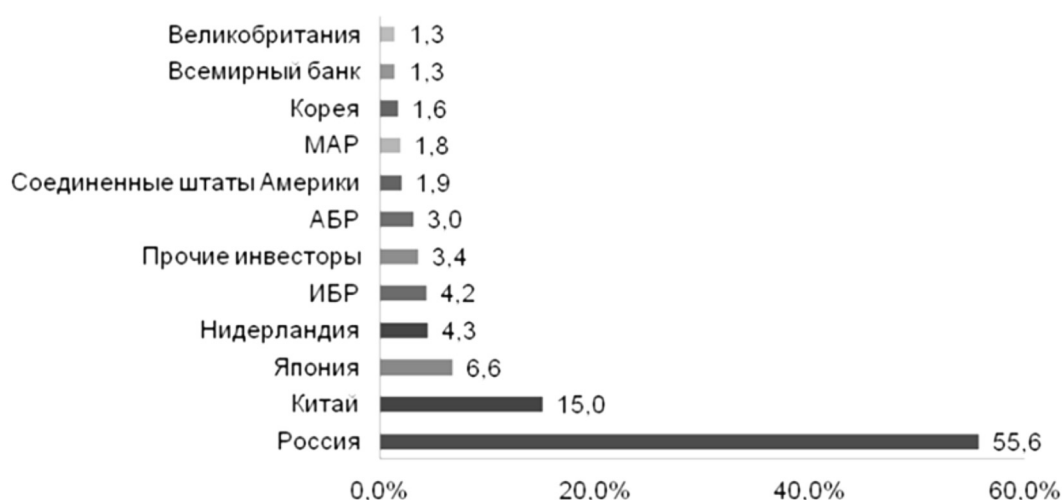
Рисунок 2. Доля иностранных инвесторов в общем объеме иностранных инвестиций и кредитов за 2017 год.

– более чем тысячекратный размер минимальной заработной платы — для кредитования инвестиционных проектов субъектов предпринимательства, на основе предусмотренных законодательством видов обеспечения.