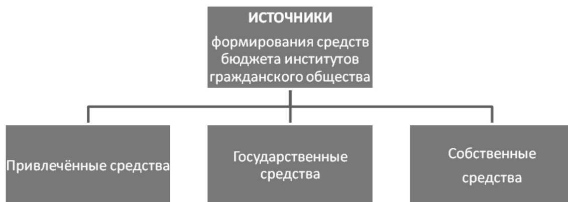
Рис 1. Структура формирования средств отечественных ННО

Привлечённые средства могут быть в виде государственной и негосударственной субсидий, социальных заказов и грантов, если они получены путём участия в публичных конкурсах, а также представляют безвозмездные материальные и нематериальные вклады спонсоров.