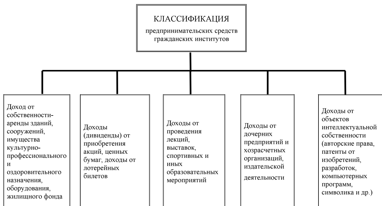
Рис 3. Структура формирования средств гражданских институтов от предпринимательской деятельности

бленного имущества, которое создает возможность финансовой основы реализации уставных целей. Гражданские институты могут получать имущественные доходы от аренды зданий и сооружений, культурно-профессионального и оздоровительного комплекса, оборудования, жилищного фонда, за счет дивидендов от приобретённых акций, депозитных сертификатов, облигаций и других ценных бумаг, продажи лотерейных билетов.