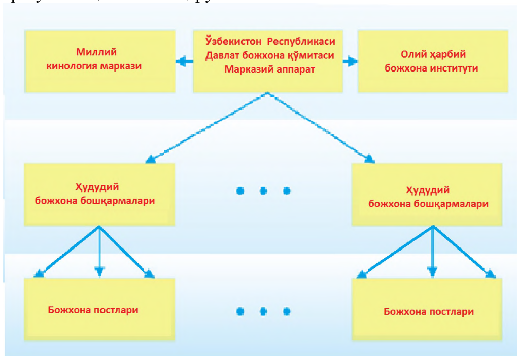
1-расм. ДБҚнинг таркибий тузилиш схемаси

Ўзбекистон Республикасининг Давлат божхона қўмитаси тизимига Марказий аппарат, Қорақалпоғистон Республикаси, вилоятлар, Тошкент шаҳар божхона бошқармалари, “Тошкент-Аэро” ихтисослаштирилган божхона комплекси, Олий ҳарбий божхона институти, Миллий кинология маркази ҳамда божхона постлари киради. Ўзбекистон Республикаси божхона органлари уч босқичли бошқарув тизимига эга: