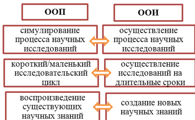
Рис. 3. Отличие ООП от ООИ

В целях более точного понимания концепции ООИ, рассмотрим ряд отличий образования, основанного на постановке проблем (ООП), и ООИ. Поскольку ООП также имеет общемировую тенденцию внедрения как оптимальный выбор при реформировании высшего образования.