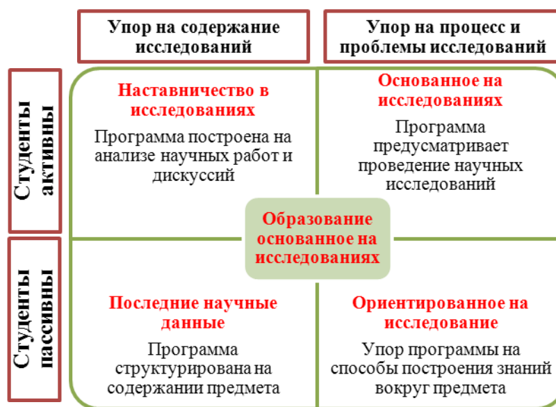
Рис. 1. Матрица ООИ (Хелли, 2005)

В каждом случае есть свои сильные и слабые стороны, причем здесь учитывается и роль студентов, которые могут быть пассивно воспринимающей аудиторией, так и активно принимать участие в процессе исследований. Как видно из матрицы, при внедрении ООИ, основанного на использовании в процессе образования последних научных исследований, и ООИ, ориентированного на исследования, студенты являются не активными и, соответственно, пассивно получают знания. С другой стороны, студенты являются активной частью процесса, как и ППС в случае использования ООИ с элементами наставничества и ООИ, основанного на самостоятельных исследованиях. В то же время в матрице предусмотрен различный ракурс на ООИ, так в случае ООИ с использованием последних научных данных и с элементами наставничества предполагает упор на содержание исследований. В то же время в ООИ, ориентированном на исследование и основанном на самостоятельном исследовании, упор делается на процесс и проблематику исследований.