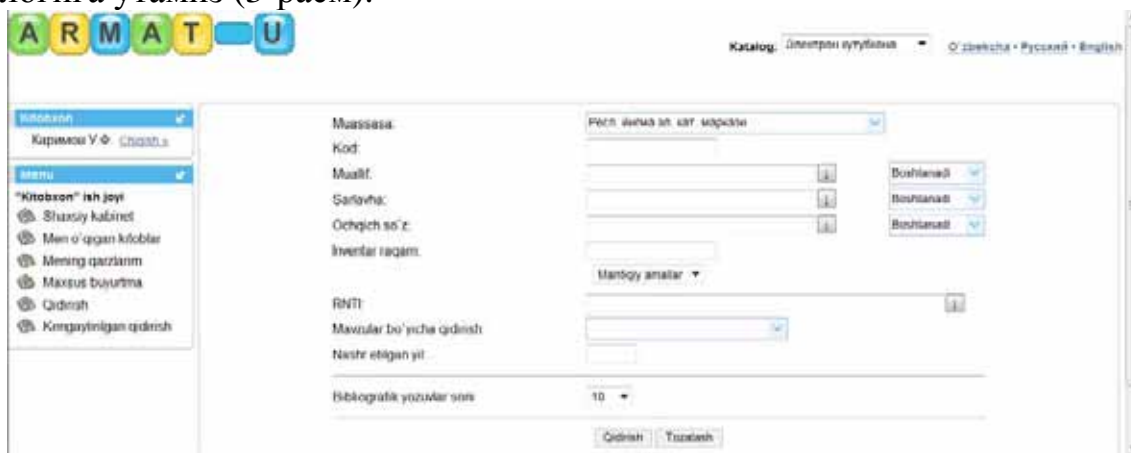
3-расм. Тизимнинг электрон каталоги.

Тизим электрон каталогдан фойдаланиб изланаётган адабиётнинг “Муаллифи” бўйича қидириш ва топилган адабиётнинг тўлиқ матнини кўриб чиқишни қарайлик. Бунинг учун фойдаланувчининг АИЎ менюсидаги “Қидириш” тугмасини сичқонча билан босамиз ва тизимнинг электрон каталогига ўтамиз (3-расм).