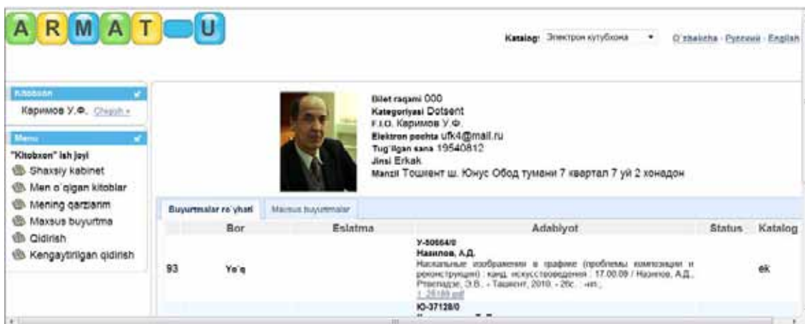
2-расм. Фойдаланувчининг автоматлаштирилган иш ўрни.

Корпоратив электрон кутубхона электрон каталогдан керакли адабиётларни қидириш учун фойдаланувчининг АИЎдаги “Қидириш” тугмасини босамиз. Натижада изланаётган адабиётнинг “Муаллиф”, “Сарлавҳа”, “Адабиёт нашр этилган йил” библиографик тавсиф элементлари ва “Очқич сўзлар” ҳамда “Илмий техникавий адабиётлар рубрикатори”дан фойдаланиб қидириш бажариш имкониятига эга бўламиз.