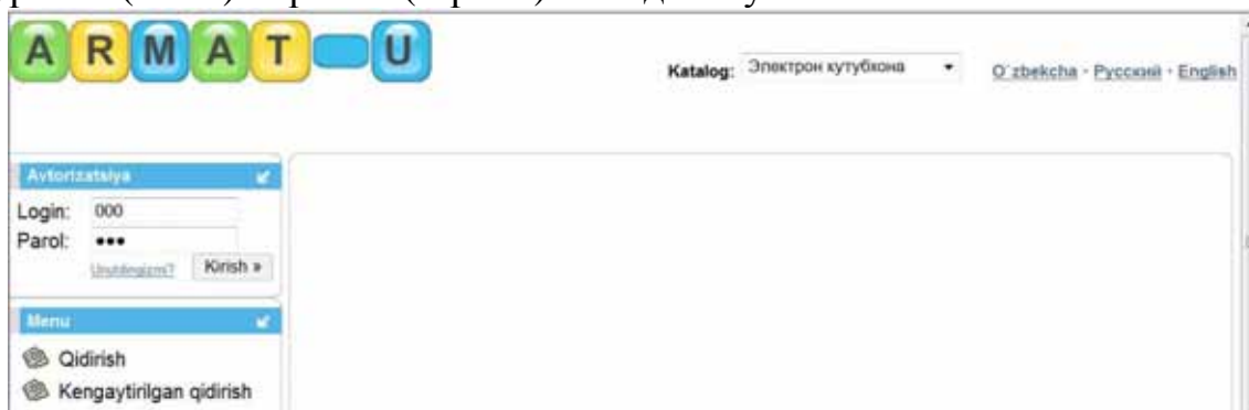
1-расм. Тизимнинг бош саҳифаси.

АРМАТ-У тизимининг бош саҳифаси қуйидаги 1-расмда келтирилган. Фойдаланувчилар “Логин” ва “Парол” майдонларига АРМдан олинган тегишли “Логин” ҳамда “Парол”ларни киритиб “Кириш” тугмаси сичқонча билан босилади. Натижада фойдаланувчиларга мўлжалланган автоматлаштирилган иш ўринга (АИЎ) кирамиз (2-расм). Фойдаланувчининг