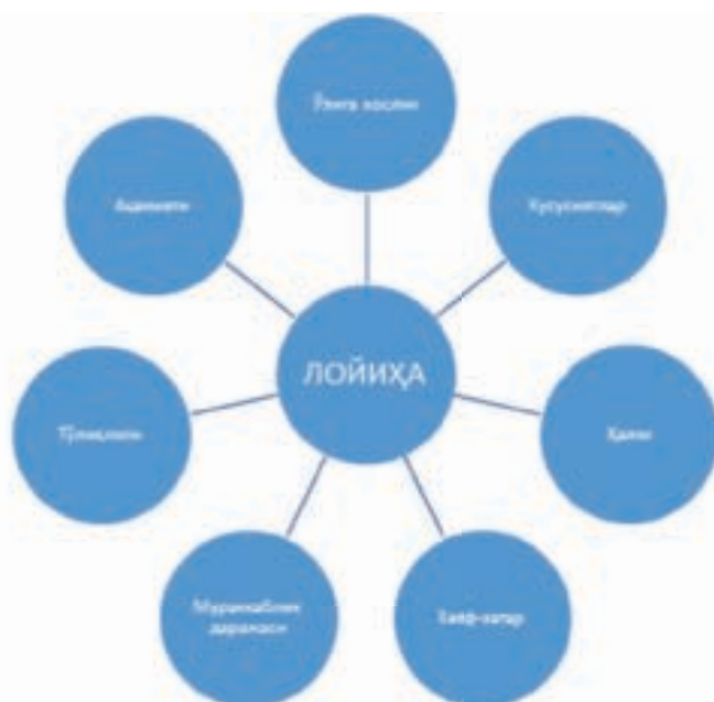
2-расм. Лойиҳага таъсир қилувчи омиллар.

Анъанавий менежментдан ўзининг тузилиши, мазмуни ва тамойиллари жиҳатидан фарқ қилувчи лойиҳа бошқаруви ўз навбатида у билан узвий боғлиқ саналади. Лойиҳаларни бошқариш функциялари анъанавий менежментнинг молиявий менежмент, ходимларни бошқариш, логистика, сифат бошқаруви, маркетинг каби соҳалари қамраб олади. Анъанавий менежментнинг мазкур вазифавий соҳаларининг лойиҳаларни бошқариш мақсадлари учун қўлланишини юқорида кўриб ўтдик. Қуйида келтирилган жадвал орқали эса анъанавий бошқарув ва лойиҳа бошқаруви ўртасидаги фарқни кўриб чиқамиз: