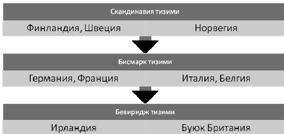
1-расм. Хорижий мамлакатларда ижтимоий ҳимоя тизимлари 1 .

ҳимоя чораси ўз эгасига етиб бориши даркор 2 ».