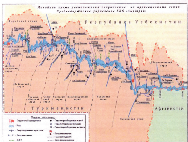
Рис.2. Этрапские производственные объединения водного хозяйства Туркменистана в среднем течении Амударьи

риториальная организация управления водными ресурсами не обеспечивает равномерную обеспеченность водой по всей длине гидрографической сети. Совершенствование управления водными ресурсами связано с переходом на бассейновый принцип управления, регулирование водных отношений в границах бассейна рек и других водных объектов [15].