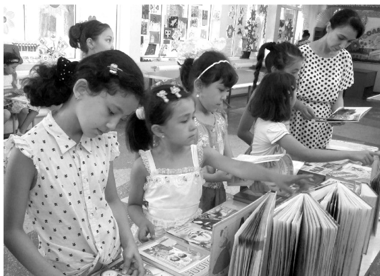
Ёзги таътилдаги кўчма кутубхонада

Аҳоли, айниқса, ўсиб келаётган ёш авлод ўртасида китобхонлик маданиятини ривожлантириш мақсадида АКМда ва Халқ таълими муассасалари билан ҳамкорликда “Энг яхши китобхон”, “Энг яхши китобхон оила”, “Менинг севимли китобим” мавзусида кўрик-танловлар жуда қизиқарли ва кўтаринки руҳда ўтказилди. Натижада ўзларининг билафонлиги, топқирлиги, зукколиги ҳамда кўп китоб ўқиганлиги туфайли 164- ва 194-мактаб ўқувчилари