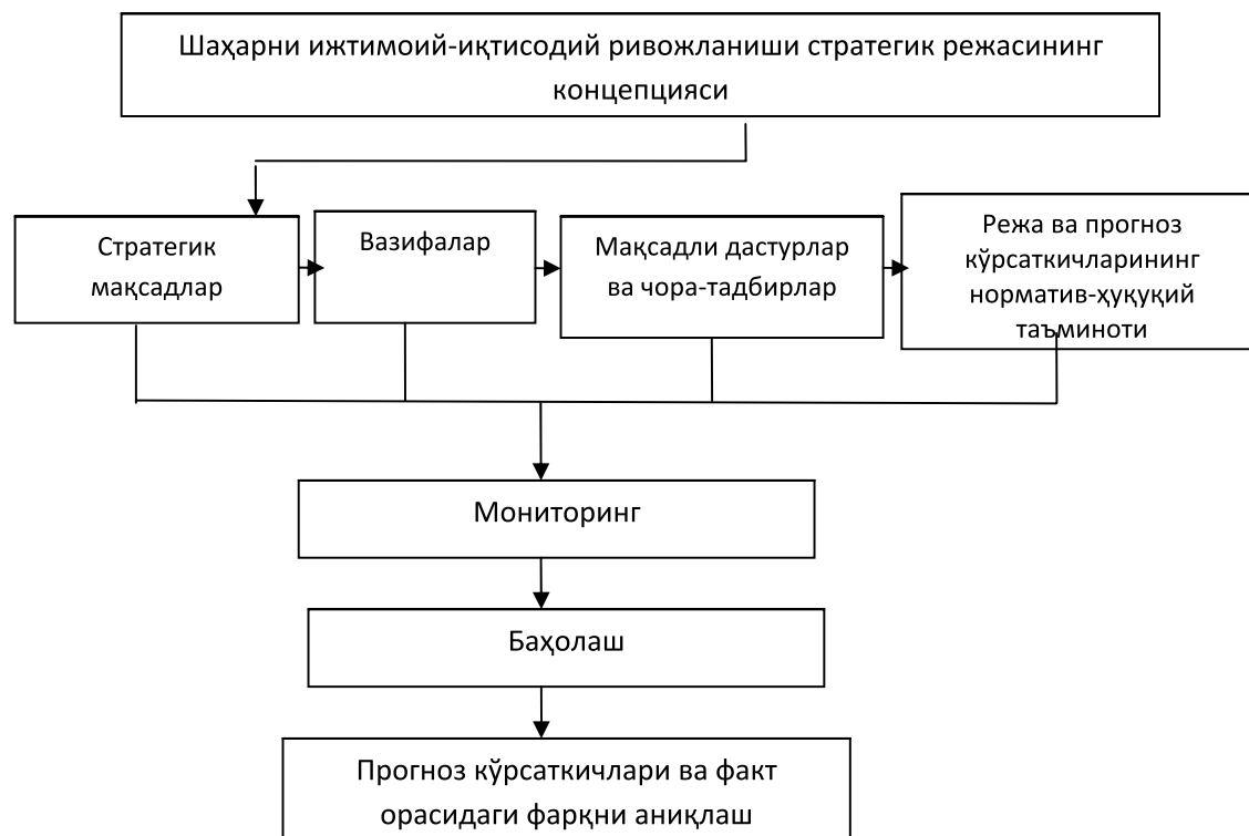
2-расм. Шаҳарнинг ижтимоий-иқтисодий ривожланишининг стратегик режаси концепцияси 1 .

кўрсаткичлар, пропорциялар, истеъмол ва иқтисодий-математик моделлаштириш усул- жамғармалар, иқтисодий ўсиш омиллари, ларидан фойдаланиш; иқтисодиёт секторлари ва ривожланиш тар- – статистик таҳлилнинг ижтимоий-иқти- моқлари ҳисобланади; содий ривожланиш жараёнлари омили дина- – прогнознинг оптимал вариантларини микасига таъсирини эконометрик баҳолаш ҳисобга олишда эконометрик таҳлил ва усулига асосланиш.