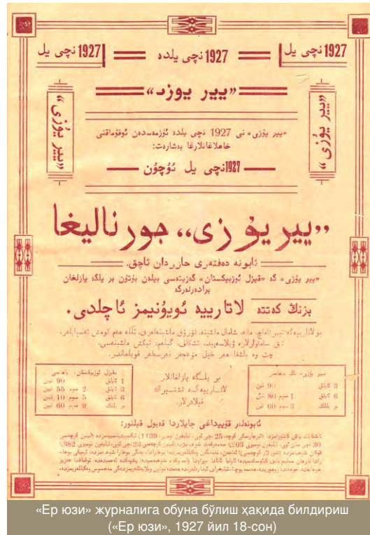
«Ер юзи» журналига обуна бўлиш ҳақида билдириш («Ер юзи», 1927 йил 18-сон)

«Ер юзи» ўзининг биринчи сони биланоқ ўқувчилар орасида кутилганидан ортиқ хусни таважжух қозонди. Жуда тез фурсатда ўз ўқувчиларини топди. «Ер юзи» ўз таъсисидан бошлаб ҳали тегилмаган маҳаллий мавзуларга тегмоққа бошлади