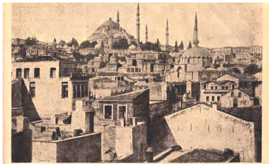
Қўشقўрғон қўрғонининг маънавий асарлари.