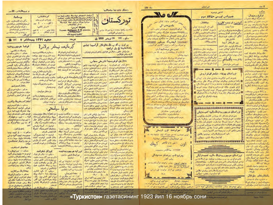
«Туркистон» газетасининг 1923 йил 16 ноябрь сони

«Ўрта Осиё жумҳуриятларида», «Ўлкамизда», «Тошкентда», «Ҳукумат тадбирлари», «Ҳукумат бошқармаларида», «Кенгашлар Русиясида», «Чет элларда», «Музофотларда», «Қишлоқ», «Уездда», «Эски Тошкентда», «Сиёсат дунёсида», «Шўро жумҳуриятларида», «Марказ ва Туркистон», «Яқин Шарқда», «Узоқ Шарқда», «Тошкент маълумотномаси», «Босмачилиқ майдони», «Босмачилиқ билан кураш», «Жаҳонгир давлатларда», «Бухоро жумҳуриятида», «Хоразмда», «Қўшни жумҳуриятларда», «Русия ва ўзгалар», «Маҳкамаи шаръия саҳифаси» (қиска муддат давом этган), «Касаба уюшмаларида», «Хотин-қизлар орасида», «Қўшчи ва ишчилар турмуши», «Фирқа ичида», «Қишлоқ хўжалиги ишлари», «Биз ва бошқалар», «Ёшлар орасида», «Фан ва техника», «Шўро сайловлари», «Қўшчилар ҳаракати», «Иқтисод ва рўзғор ишлари», «Фирқа турмушидан», «Илм ва фан», «Қўшчи уюшмаларида», «Туркистон бойлиқлари», «Кустарлар турмуши», «Табиат ҳодисалари», «Кооперация ишлари», «Қишлоқ мухбирлари-миздан», «Пахтачилик», «Хуросотларга қар-