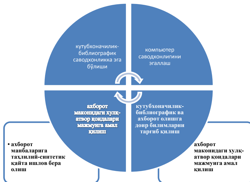
Расм 2. Ахборот олиш маданиятининг таркибий элементлари

Бугунги кунда кутубхонага кирмай, китоб ўқимай, умумий ўрта таълим олмай, ҳаёт сари қадам қўяётган ёшларнинг ўзи йўқ. Ўз касбига оид адабиётлар, даврий матбуот материалларини кўздан кечирмай меҳнат қилаётган мутахассисни ҳам топиш қийин. Лекин асосий масала улар мавжуд ахборотлардан қанчалик унумли фойдалана олаётганликларидадир.