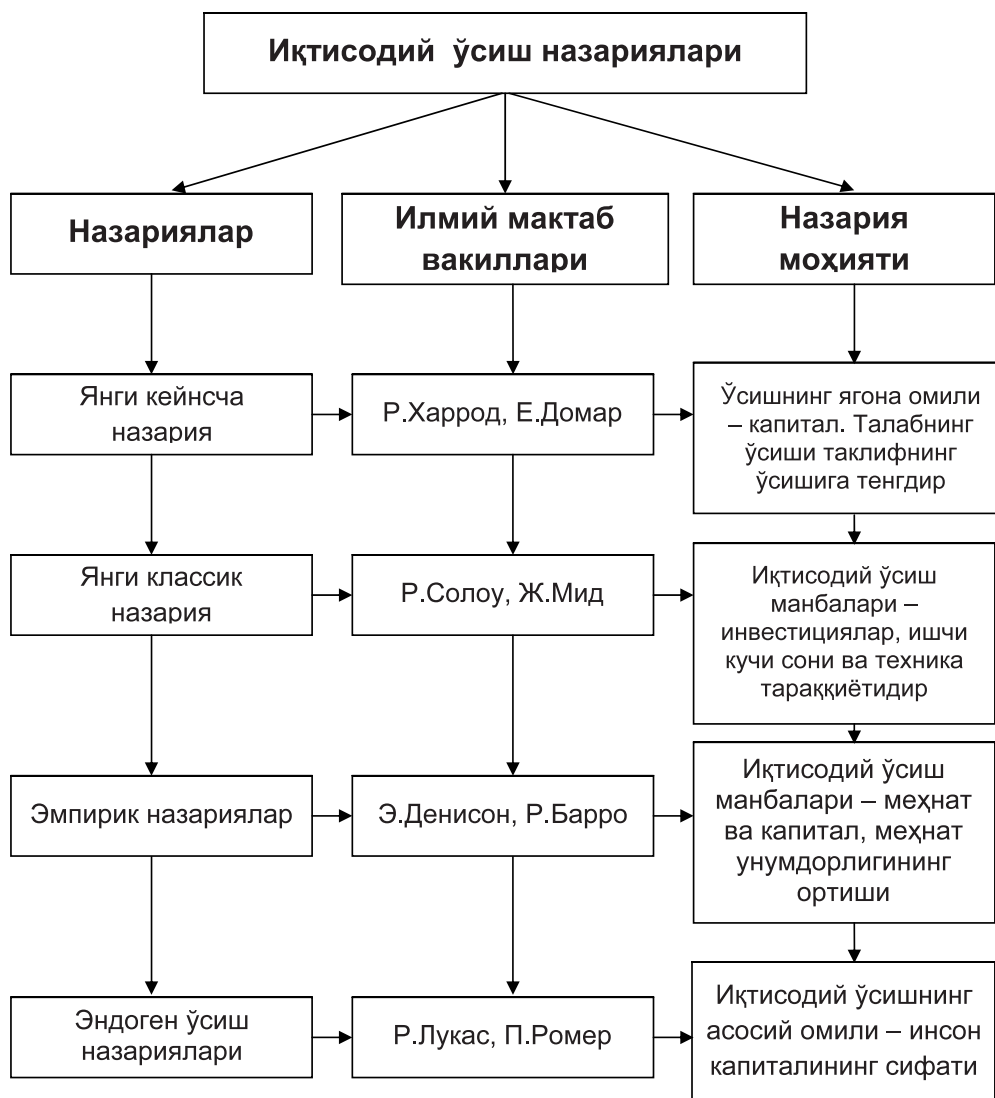
1-расм 1 . Эндоген ўсишнинг янги назариялари.

тирувчи ва мустаҳкамловчи иқтисодий-сиёсий вазият тенденцияси ҳукм сурмоқда.