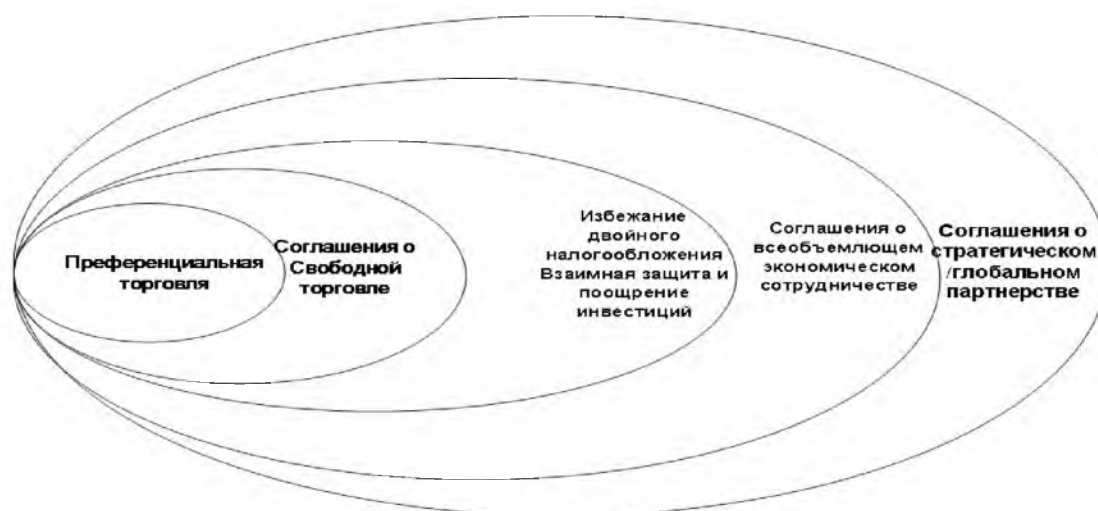
Рис. 1. Этапы развития экономического сотрудничества.

экономической интеграции. Первое имеет свои этапы развития (рис.1) и не затрагивает государственного суверенитета, в то время как второе (рис.2) предполагает добровольное ограничение суверенитета государств-членов.