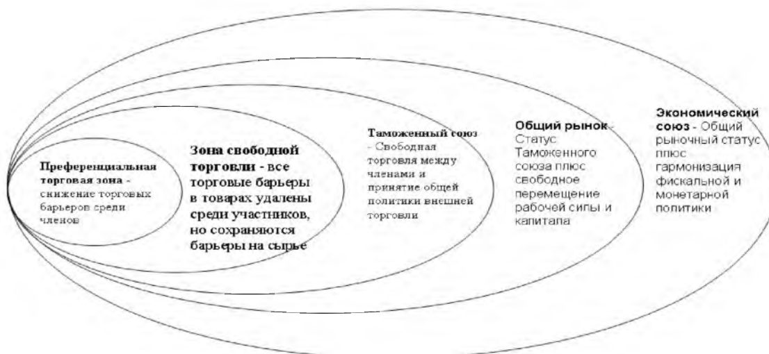
Рис. 2. Этапы развития региональной экономической интеграции.

Термин «экономическая интеграция» стали употреблять в 1930-е годы немецкие и шведские экономисты, однако до сих пор для термина