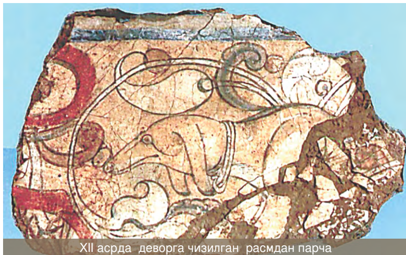
XII асрда деворга чизилган расмдан парча

Қўлёзма фондларга келиб тушгандан кейин, аввало, биринчи ишловдан ўтказилади. Китоб узоқ муддат ноқулай жойда сақланиб, чанг босган бўлиши мумкин. Шунинг учун у бошидан охиригача варақланиб, ҳар бир варақ тозаланиб, очиқ ҳавода шамоллатилади.