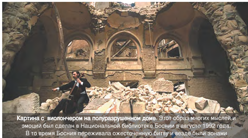
Картина с виолончлером на полуразрушенном доме. Этот образ многих мыслей и эмоций был сделан в Национальной библиотеке Боснии в августе 1992 года. В то время Босния переживала ожесточенную битву и везде были зонами

Городская ратуша, где находится библиотека в течение нескольких десятилетий, была реконструирована благодаря донорам и заинтересованным сторонам, в частности Европейской комиссии. Но, к сожалению, Национальная университетская библиотека Боснии и Герцеговины по-прежнему находится в непригодных и временных местах университетского городка.